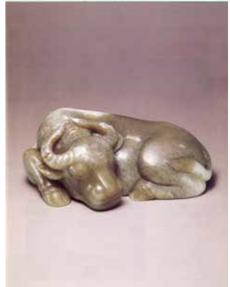
2005年5月30日 佳士得香港 編號 1544