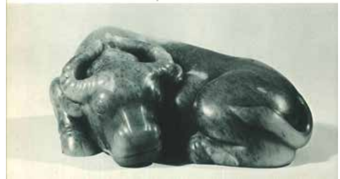
Minnesota Museum of Art, St. Paul, M, 1975 明尼蘇達州博物館